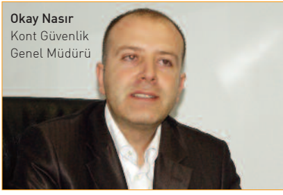
Okay Nasır Kont Güvenlik Genel Müdürü

merkezlerine inşaat sektöründe çok yatırım yapıldığını, bunun da elbette güvenlik sektörüne olumlu yansıdığını belirtiyor.